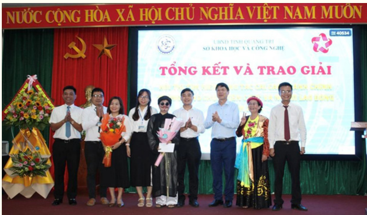
Tổ chức Hội thi “Tìm hiểu cải cách hành chính Sở Khoa học và Công nghệ năm 2024”

phẩm mới có giá trị gia tăng cao. Chú trọng nghiên cứu ứng dụng công nghệ cao, các công nghệ chủ chốt của cuộc Cách mạng công nghiệp lần thứ tư vào các ngành, lĩnh vực. Đẩy mạnh ứng dụng rộng rãi công nghệ sinh học trong các ngành, lĩnh vực.