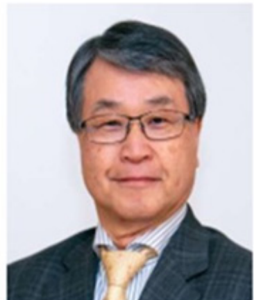
Seizo Onoe Giám đốc ITU

mục tiêu phổ quát được thiết kế nhằm chấm dứt đói nghèo, bảo vệ hành tinh và đảm bảo rằng tất cả mọi người được hưởng hòa bình và thịnh vượng vào năm 2030 ở mỗi quốc gia thành viên Liên hiệp quốc.