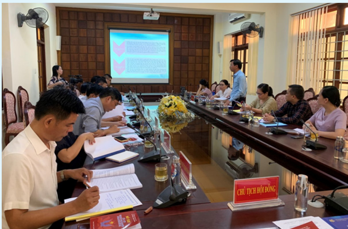
Đơn vị chủ trì báo cáo trước Hội đồng nghiệm thu đề tài.

Quản lý nhà nước với công tác thi đua, khen thưởng có vị trí, vai trò quan trọng trong tổ chức thành công các phong trào thi đua yêu nước. Để từ đó có cơ sở khách quan, khoa học trong việc kịp thời khen thưởng đúng người đúng việc mới làm cho phong trào