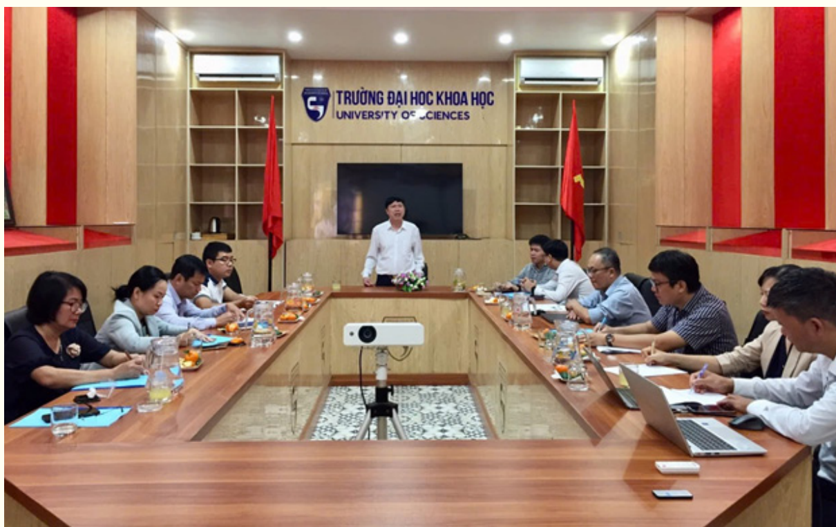
Sở KH&CN làm việc với Đại học Khoa học Huế về đề tài “Nghiên cứu phát triển công nghệ Biofloc dựa trên nguồn vi sinh bản địa nhằm tăng tính hiệu quả và bền vững nghề nuôi tôm thẻ chân trắng ở tỉnh Quảng Trị”

liên quan triển khai có hiệu quả các cơ chế, chính sách hỗ trợ người dân, doanh nghiệp trong lĩnh vực KH&CN như: Kế hoạch thực hiện Chương trình phát triển tài sản trí tuệ tỉnh Quảng Trị đến năm 2030; Kế hoạch Hỗ trợ khởi nghiệp đổi mới sáng tạo trên địa bàn tỉnh Quảng Trị đến năm 2025; Chương trình phát triển thị trường KH&CN, doanh nghiệp KH&CN tỉnh Quảng Trị đến năm 2030; Kế hoạch Triển khai Chương trình hỗ trợ doanh nghiệp tỉnh Quảng Trị nâng cao năng suất và chất