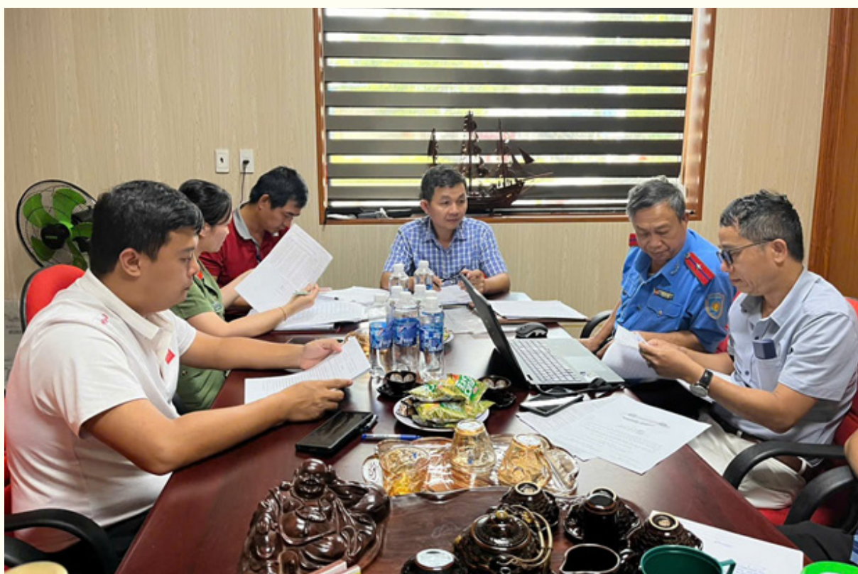
Đoàn thanh tra về đo lường đối với chi nhánh công ty cổ phần Suntaxi tại Quảng Trị.

Thực hiện Quyết định thanh tra số 09/QĐ-TTra ngày 02/08/2024 của Chánh Thanh tra Sở Khoa học và Công nghệ Thanh tra về đo lường đối với các cơ sở kinh doanh dịch vụ vận tải hành khách trên địa bàn tỉnh Quảng Trị, từ ngày 20/08/2024 đến ngày 12/09/2024, Đoàn thanh tra đã tiến hành thanh tra tại 03 doanh nghiệp hoạt động kinh doanh taxi vận tải hành khách.