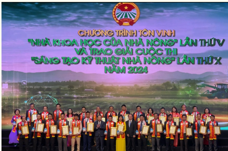
Toàn cảnh buổi trao giải.

Đến dự, có đồng chí Nguyễn Trọng Nghĩa, Ủy viên Bộ Chính trị, Bí thư Trung ương Đảng, Trưởng Ban Tuyên giáo Trung ương; các đồng chí Ủy viên Trung ương Đảng: Lương Quốc Đoàn, Chủ tịch Hội Nông dân Việt Nam; Huỳnh Thành Đạt, Bộ trưởng Khoa học và Công nghệ; Phạm Tất Thắng, Phó Trưởng Ban Thường trực Ban Dân vận Trung ương; đại diện lãnh đạo các ban, bộ, ngành, Hội Nông dân các địa phương trên cả nước.