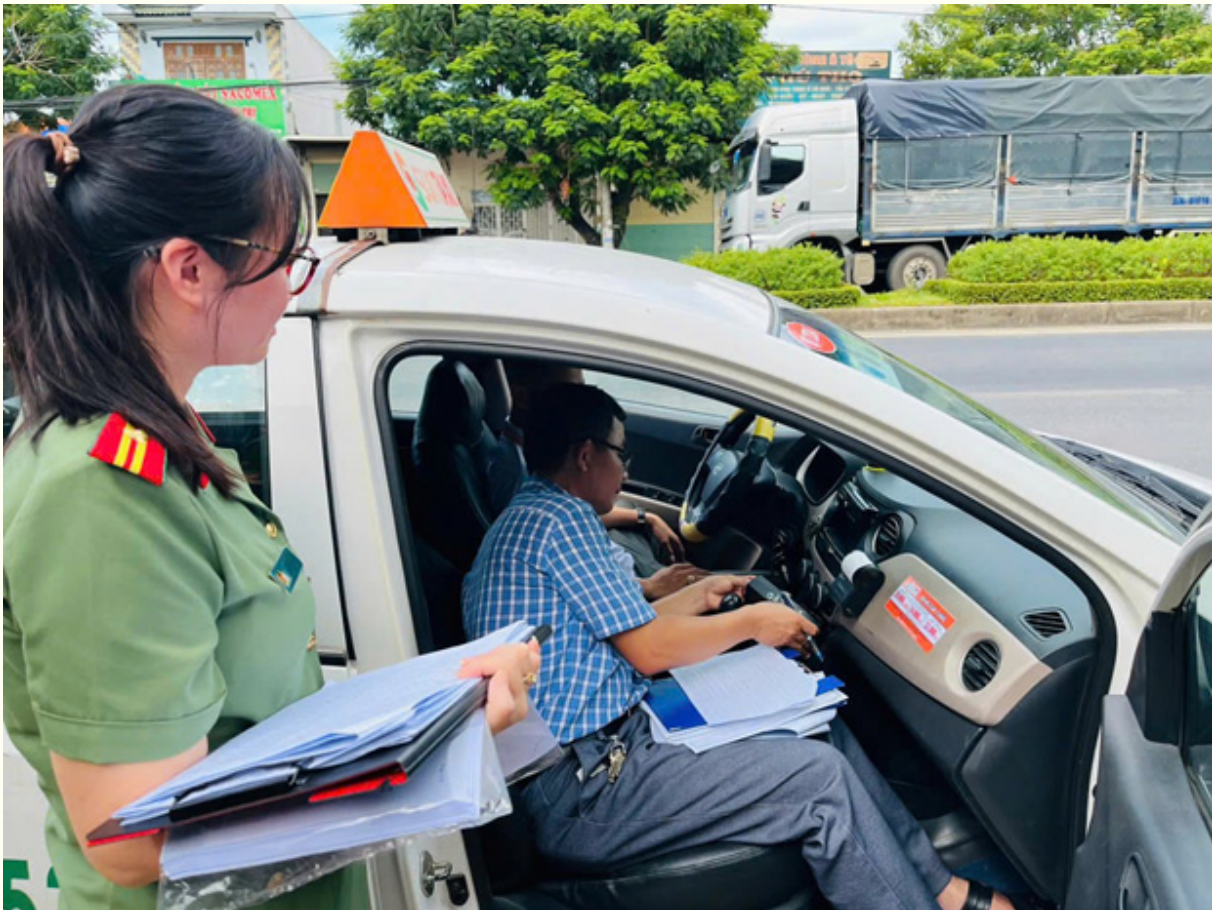
Đoàn thanh tra phạt tiền 3.000.000 đồng đối với Chi nhánh Công ty Cổ phần Sntaxi tại Quảng Trị

đạt yêu cầu kỹ thuật và có sai số phù hợp với quy định hiện hành, thông tin trên taximet phù hợp với quyết định phê duyệt mẫu. Đa số các taximet đều được kiểm định và có giấy chứng nhận kiểm định còn hiệu lực; niêm phong, kẹp chì trên taximet phù hợp với chứng nhận kiểm định.