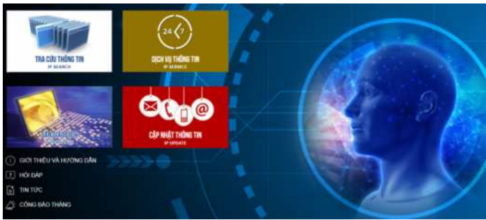
Giao diện nền tảng IPPlatform.

Hội nghị “Kết nối chủ thể quyền sở hữu trí tuệ trên Nền tảng IPPlatform với các chủ thể của hệ sinh thái khởi nghiệp đổi mới sáng tạo (ĐMST) khu vực phía Nam” đã được tổ chức vào tháng 7/2024 tại Thành phố Hồ Chí Minh, với sự phối hợp của Viện Khoa học sở hữu trí tuệ và Sở Khoa học và Công nghệ (KH&CN) Thành phố Hồ Chí Minh.